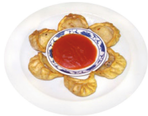
K3 Gebratene Teigtaschen (A,C,F) mit Gemüse und Faschiertem gefüllt 3,80 €