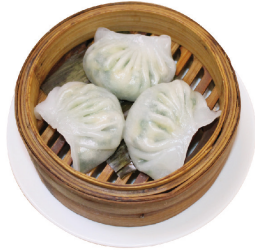
K2 Gedämpfte Garnelentaschen (B) mit Bärlauch 3,50 €