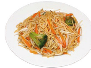
K9 Nudeln mit Gemüse (A,C,F) 4,50 €