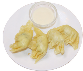
K5 Gebackene Garnelentaschen (A,B,C) 3,90 €