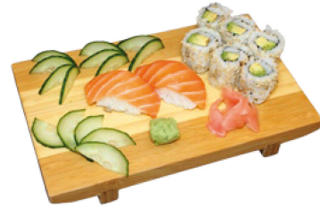
K8 Sushi & Maki (D,N) 5,50 € 2 Lachs Sushi & 6 Avocado Maki