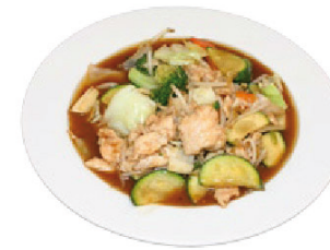
K11 Hühnerfleisch (F) 5,50 € mit Saisongemüse und Reis