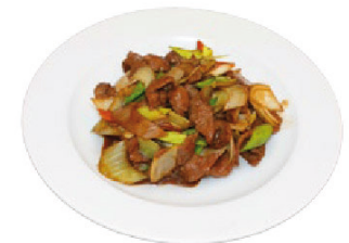
K14 Bulgogi (F) 6,00 € Mongolisches Rindfleisch, mit Reis