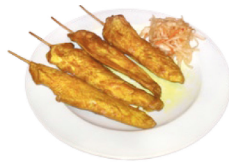
K4 Saté Hühnerspieße (E,F) 6,50 € in Erdnuss-Sauce, mit Reis