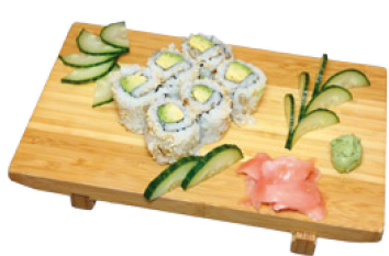
K7 Avocado Maki (N) 3,90 € 6 Stück