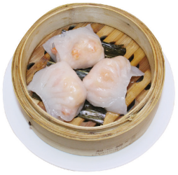
K1 Gedämpfte Garnelentaschen (B) 3,50 €