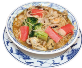
K6 La Mian Nudelsuppe (A,B,C,F,R) mit Meeresfrüchten 6,00 €