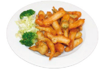
K10 Gebackenes Gemüse (A) 3,50 €