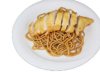
K16 Nudeln mit knusprigem Huhn (A,C,F) 6,50 €