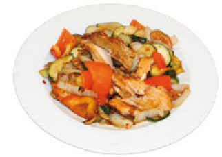
K12 Lachs mit Gemüse (D,F) 6,00 € und Reis