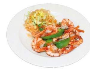
K15 Wok-Garnelen (B,F) 7,50 € mit Reis